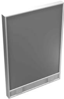
Ciegos - Opaque - Opaques

TODOS LOS MODELOS SE FABRICAN EN 2 GRUESOS: 60 y 40 mm. - ALL THE MODELS ARE FABRICATED IN 2 THICKS: 60 and 40 mm. - TOUS LES MODELES SONT FABRIQUÉS EN ÉPAISSEURS: 60 mm ET 40 mm.