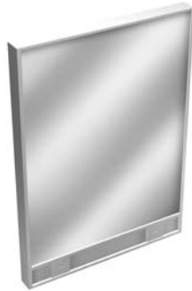
Cristal - Glass - Vitrées