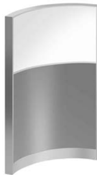
Mixtos - Mixed - Mixtes