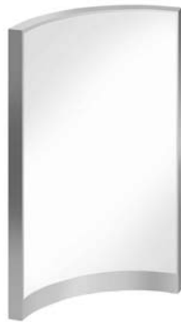
Metacrilato - Methacrylate - Métacrilate