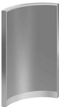
Ciegos - Opaque - Opaques