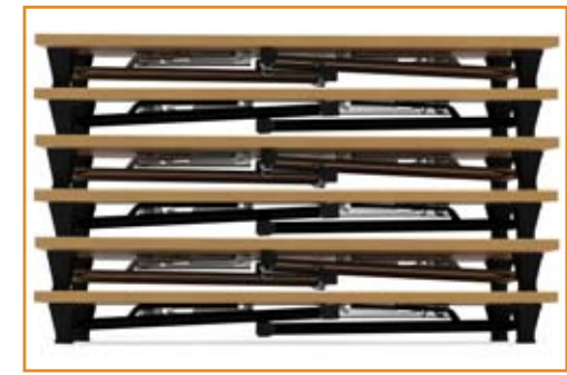
Empilháveis / Stockable