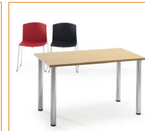
Ref.: UTY 126C.O