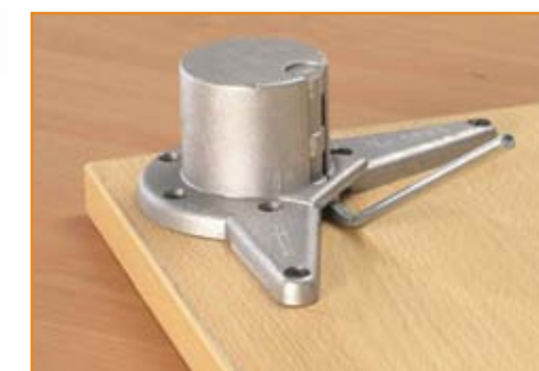
Sistema rápido de fixação do pé

* Outras medidas sob consulta / Ask for other sizes