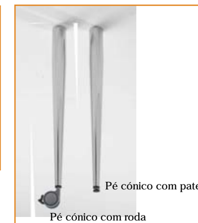
Pé cónico com pater Pé cónico com roda