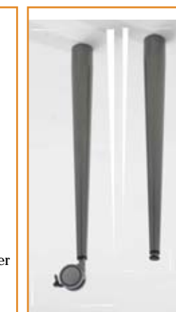
Pé normal com nivelador