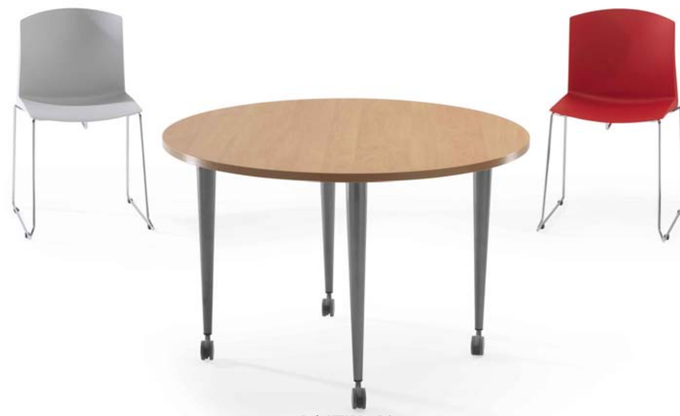
Ref.: UTY RR11PO