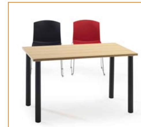
Ref.: UTY 126P.O