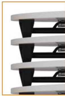
Empilháveis / Stockable