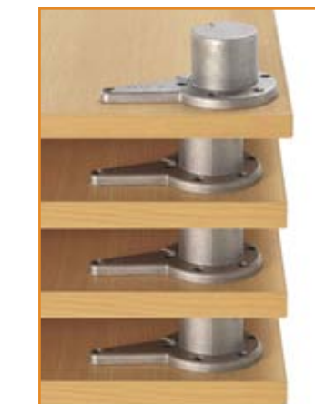
Empilháveis / Stockable