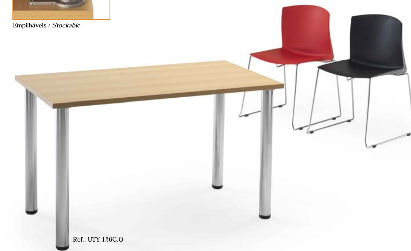
Ref.: UTY 126C.O