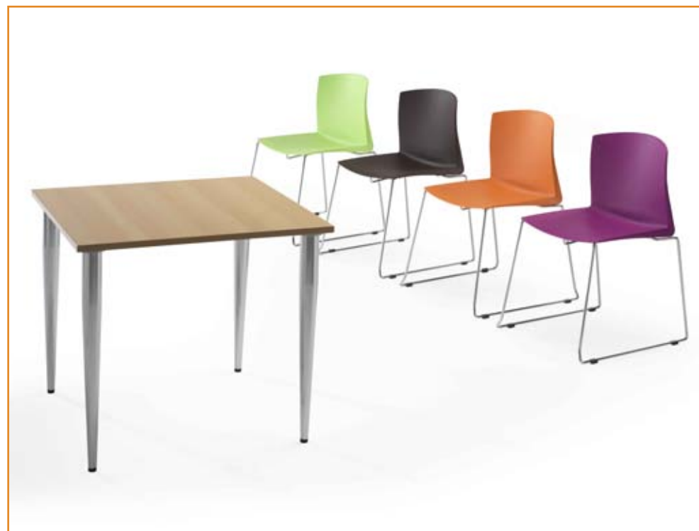
Ref.: UTY C808C.O

The table legs are made of powder coated metal with black or chromium-plated finish.