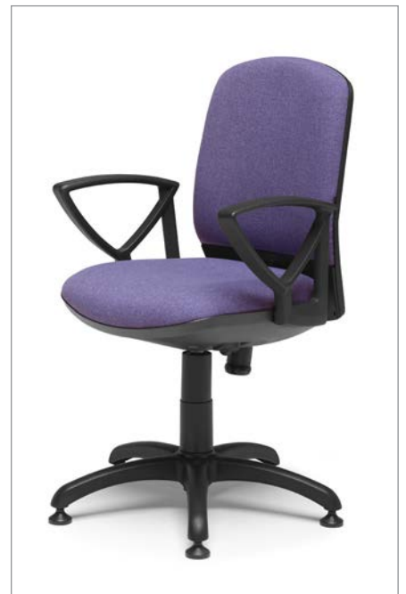
Ref.: ML-05 + ML-PVC2 (Com retorno automático)