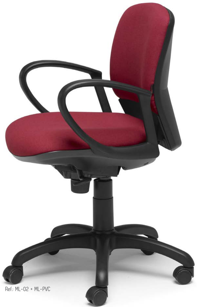
Ref: ML-02 + ML-PVC