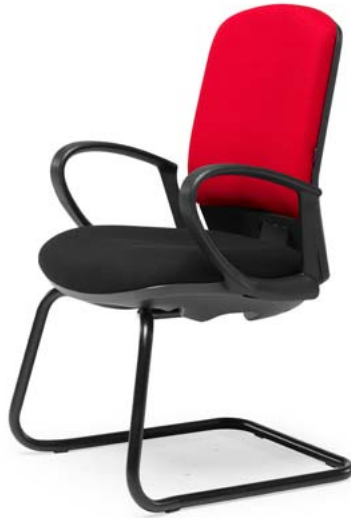
Ref: ML-06 + ML-PVC