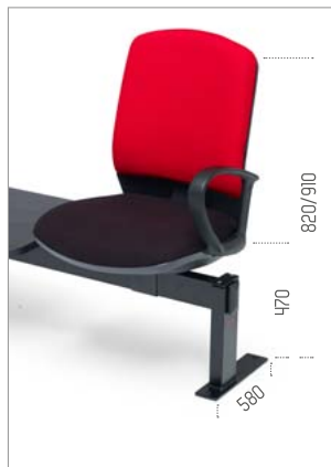
Ref: ML-TFXNR (ref. de pé)