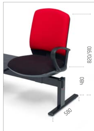
Ref: ML-TANR (ref. de pé)