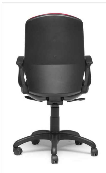
Ref: ML-01 + ML-PVC