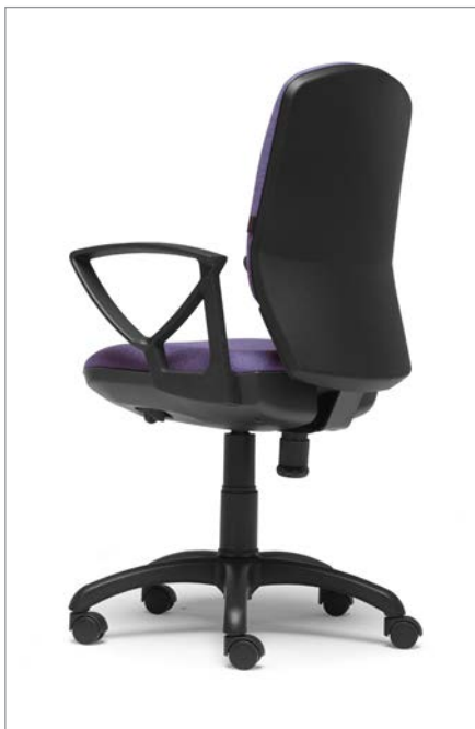
Ref.: ML-03 + ML-PVC2