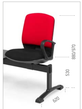
Ref: ML-TINR (ref. de pé)