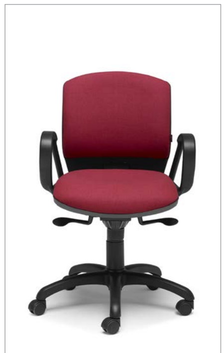
Ref: ML-02 + ML-PVC